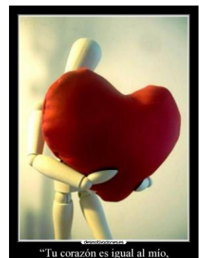
"Tu corazón es igual al mío,"