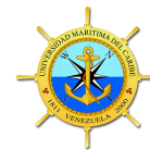
Ilustración 6: Modelo. Fuente elaboración propia